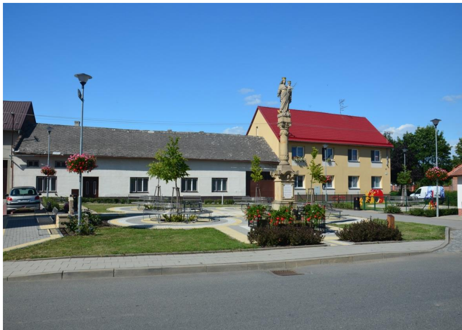
Za nově upravenou návší v pozadí dům č.p. 26 (bílá fasáda), vpravo bytový dům

Financování: Vlastní zdroje, Program obnovy venkova, Ministerstvo pro místní rozvoj