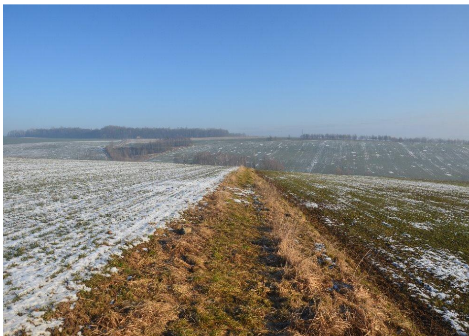
Budoucí účelová komunikace, p. č. 1400, stav po priorávaní

Riziko nežádoucích účinků přivalových dešťů z důvodu nevhodného obhospodařování zemědělské půdy, nedostatek prvků v krajině tomuto riziku zabraňujících, nerespektování výměr účelových komunikací a tím poškozování obecního majetku při obdělávání zemědělských ploch. Příklad – p. č. 1400, ostatní komunikace, určeno pro realizaci PSZ, šíře dle KN 7,5 m, skutečná dle obr. do 2 m a nepoužitelná.