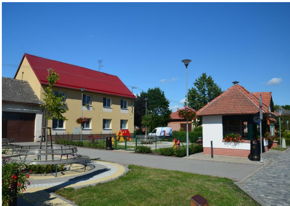
Centrum obce, autobusová zastávka, bytový dům, dětské hřiště

Strategický plán rozvoje obce Hradčany byl zpracován v souladu se strategickými dokumenty Olomouckého kraje a ORP Přerov.