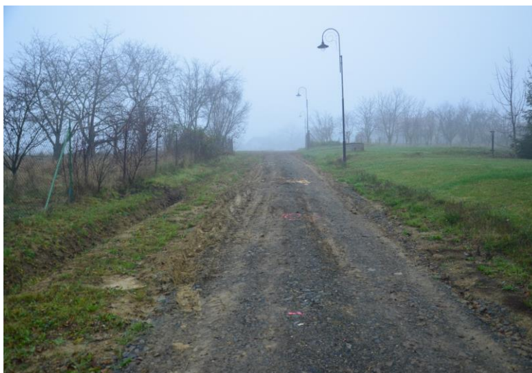
Současný stav místní komunikace p. č. 143 a 1444

Financování: MMR, Pozemkový úřad, Olomoucký kraj, vlastní zdroje