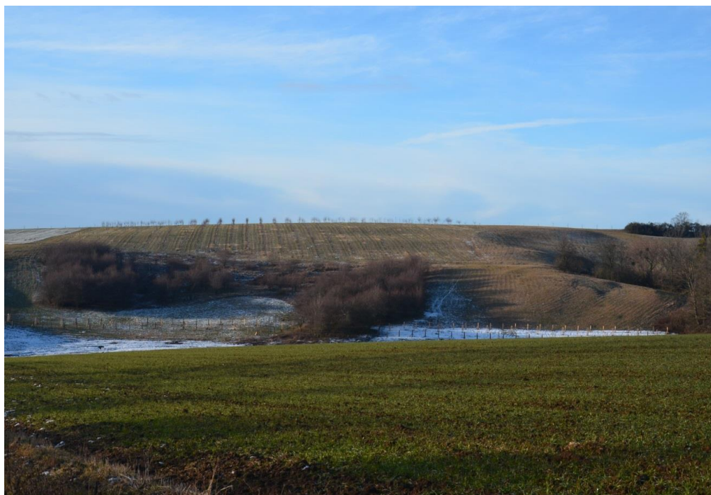
Lokalita Tvrdé doly nad nádrží N2

Financování: vlastní zdroje, vhodné dotace