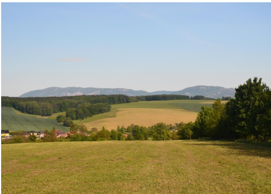
Pohled na krajinu v okolí údolí Šišemky, v pozadí Dřevohostický les a Hostýnské vrchy přes zastavitelnou lokalitu Záhonky