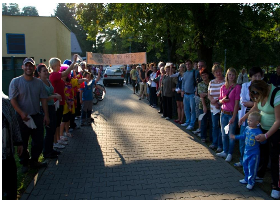
Účast občanů na prezentaci soutěže Vesnice roku