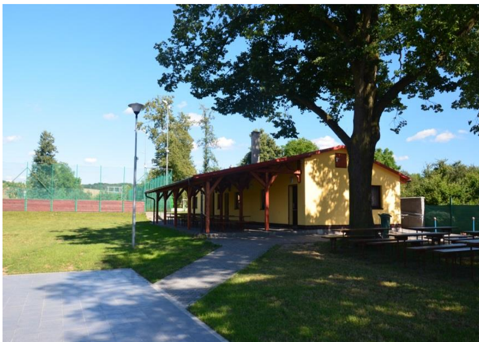
Provozní budova Výletišť, v pozadí víceúčelové hřiště

Provedena generální oprava veřejného osvětlení včetně kabeláže, výměna svítidel za úsporné při dodržení hygienických norem.