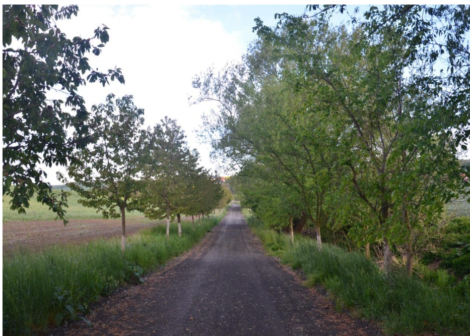
Alej k nádrži N1 vhodná k vytvoření rekreační zóny

Financování: vhodné dotace, vlastní zdroje