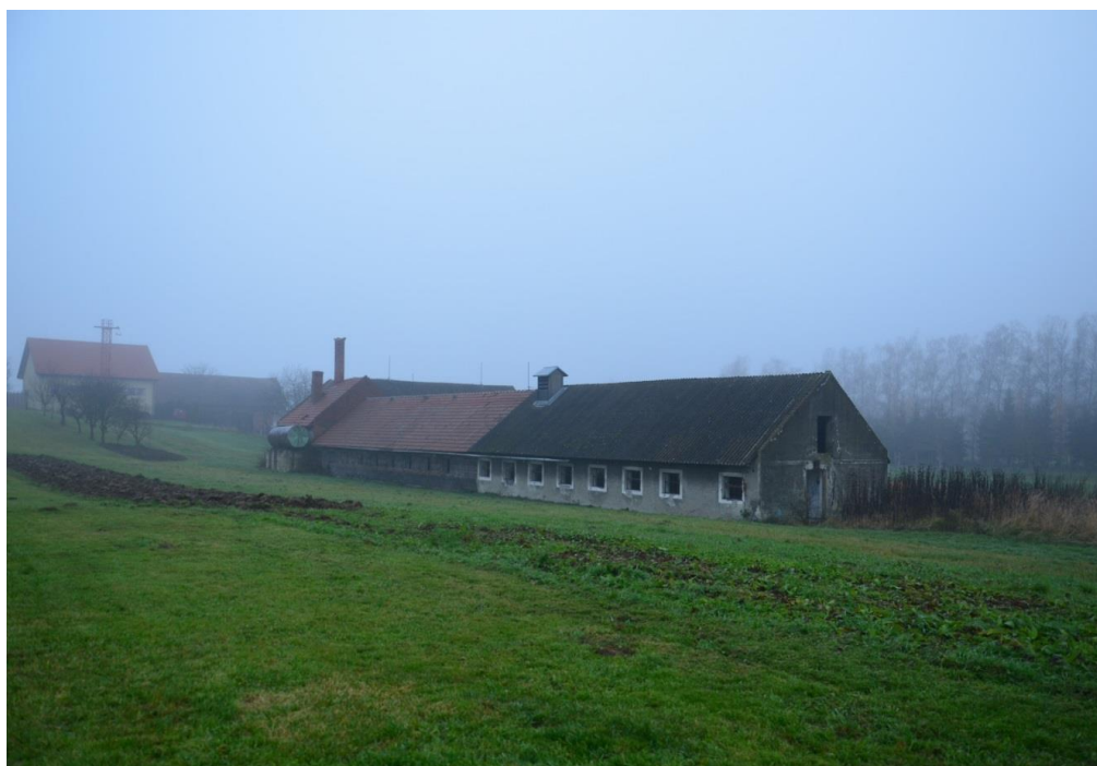
Současný stav bývalého vepřínu, nyní v majetku obce

Financování: vlastní zdroje, vhodné dotace