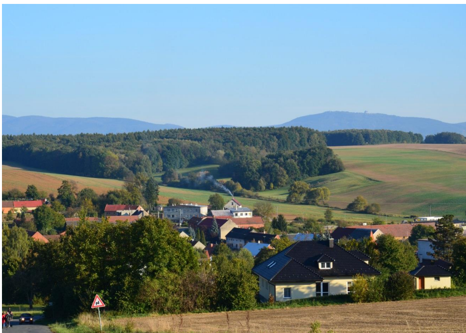
Pohled na obec Hradčany ze západní strany s výhledem na Hostýnské vrchy