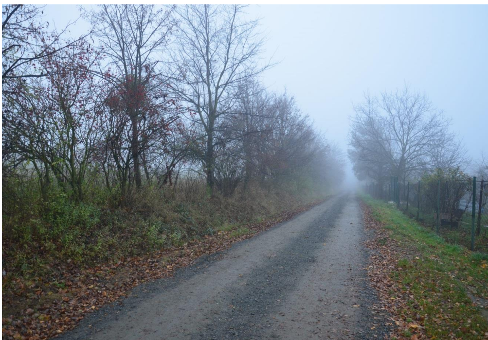
Spodní okraj zastavitelného území Záhonky

Financování: vlastní zdroje, vhodné dotační tituly