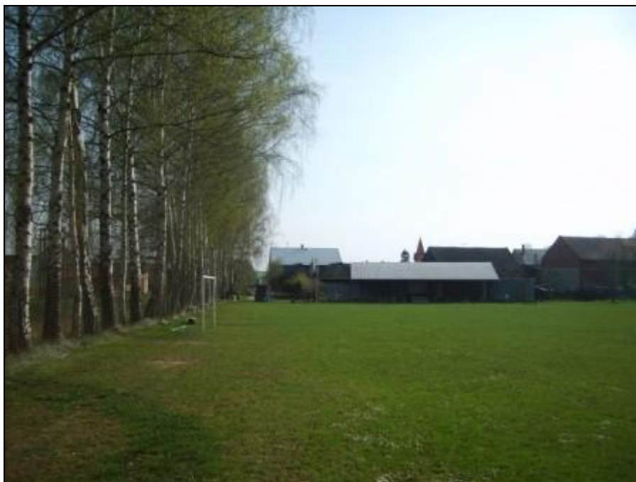
Foto č. 3 Fotbalové hřiště